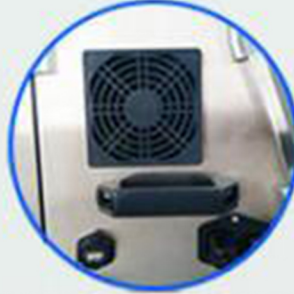
Fan ve Usb Bağlantı Noktası, Güç Fişi